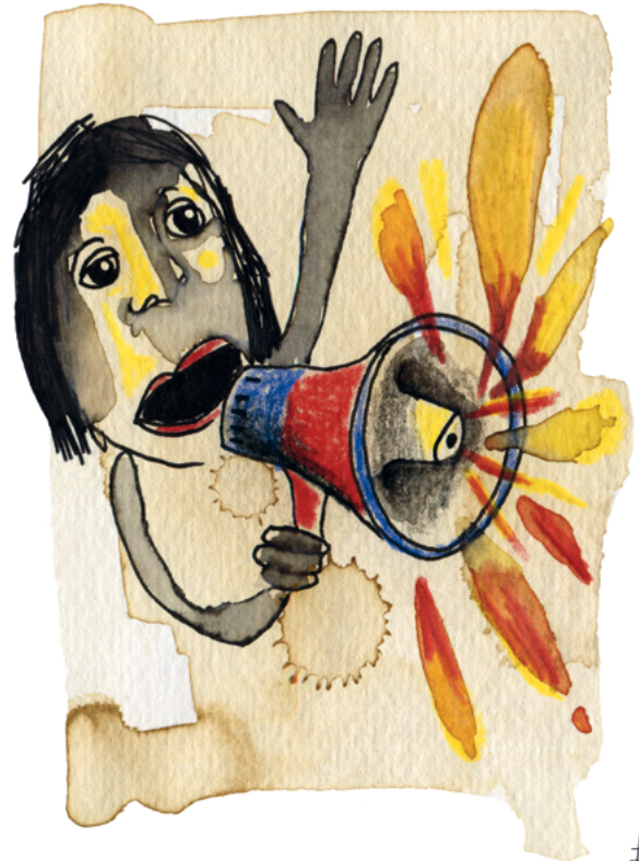
ILLUSTRATION DE DANIELA DE FELICIE

#10 Les rencontres du réel 4 · 5 · 6 novembre 2022 FESTIVAL DE CINÉMA DOCUMENTAIRE Le Buisson de Cadouin Cadouin